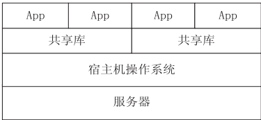
图 1 容器虚拟化原理图

LXC 是 Linux Containers 的简称,是一种基于容器的操作系统层级的虚拟化技术。对于像 KVM、XEN 等平台虚拟化技术来说,LXC 采用完全不同的方法 [4] 。平台虚拟化是在仿真的硬件上引导单独的虚拟系统并通过半虚拟化技术等相关机制降低开销。LXC 不是在全隔离的基础改进效率,而是通过简易的机制实现隔离。从而实现的系统虚拟化机制可以像 chroot 一样扩展和移植,能够在同一个服务器同时支持数千台的仿真系统 [4] 。如图 1 所示,LXC 不需要 XEN 和 KVM 所必须的虚拟机监控层就可实现资源的隔离,共享库之上的应用程序 A 和 B 属于同一个容器,而 C 和 D 则属于另一个容器。不同的容器之间互不干扰,同一个容器内的进程可以正常通信。