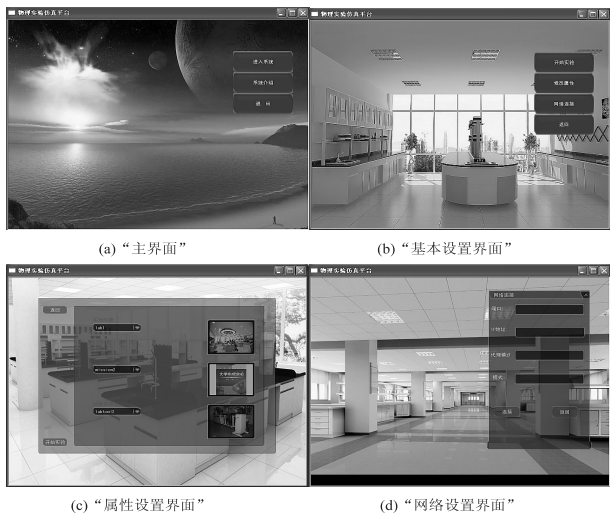
图2 “主界面”、“基本导向设置”状态的界面 (3)运行状态。

“基本导向设置”状态包括两个子状态:“属性设置”状态和“网络设置”状态。“基本导向设置”状态包括四个按钮:“开始实验”、“修改属性”、“网络连接”、“返回”(如图2(b)所示)。四个按钮分别对应的回调函数是:跳转到“运行”、“属性设置”、“网络连接”、“主界面”状态。“属性设置”状态可以改变系统的默认设置,包括实验环境、实验任务、特殊实验工具的设置(如图2(c)所示)。“网络连接”状态,包括设置系统所有网络参数(如图2(d)所示),实现服务器端(讲师)与客户端(实验者)之间的网络连接。网络互连功能使得平台的实用性更强:拥有远程教学、讲师演示、远程协助等功能。