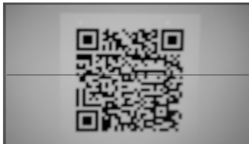
图 2 识别空调二维码

设备列表中仅有冰箱一项,点击“添加”按钮进入二维码识别和 DPL 解析,见图 3。